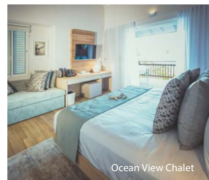
Ocean View Chalet