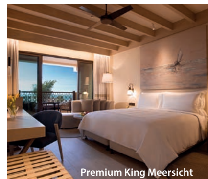
Premium King Meersicht